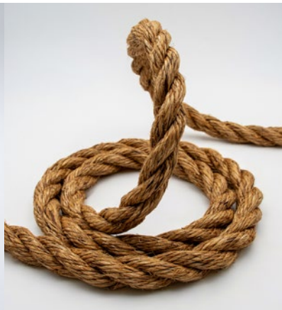
Manila-Naturfaser Manila natural fiber