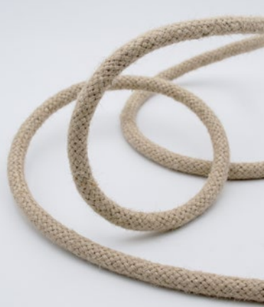
Jute-Naturfaser Jute natural fiber