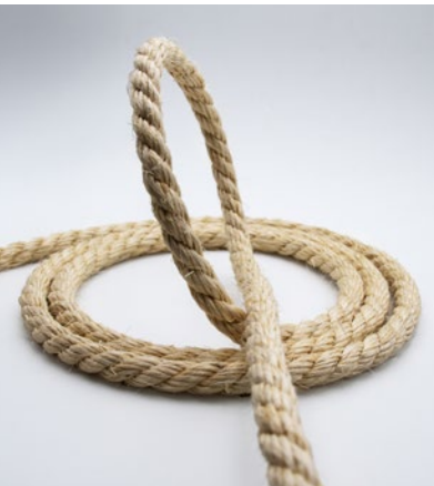
Sisal-Naturfaser Sisal natural fiber