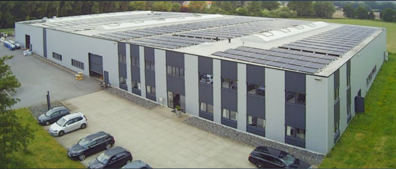
Standort | location Schöppingen