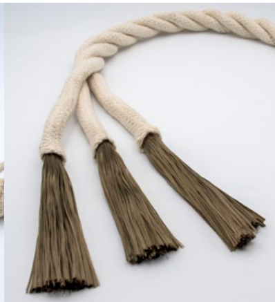
Basalt-Natursteinfaser Basalt natural stone fiber