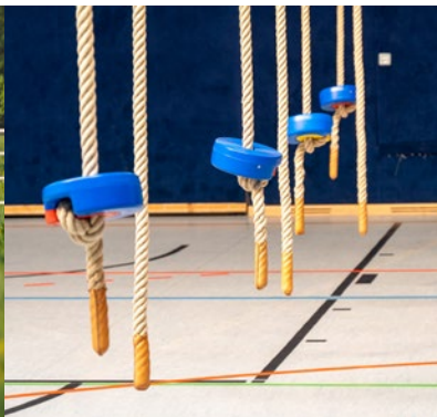
Sport und Freizeit Sport and recreation