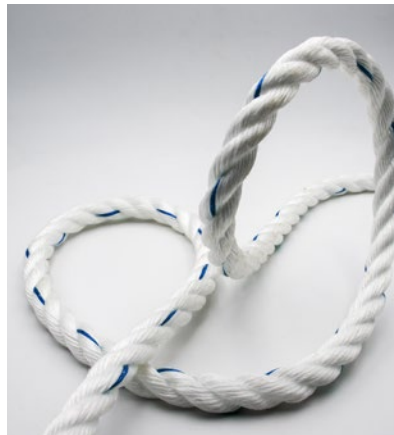
Polypropylen-Kunstfaser Polypropylen synthetic fiber