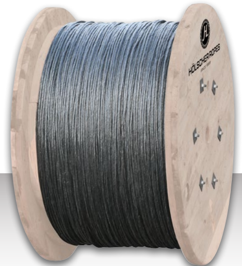
Kabeltrommel cable drum