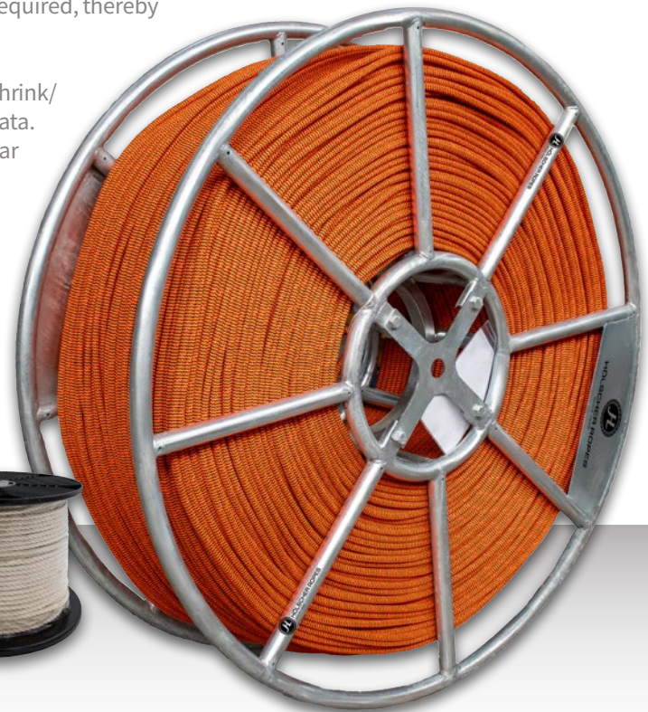
Stahltrommel, auch kundeneigen steel drum, also customer-specific