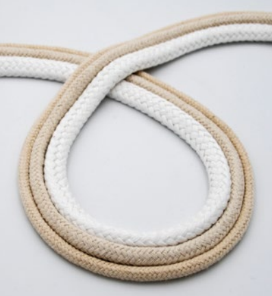
Baumwoll-Naturfaser Cotton natural fiber

Sie finden Einsatz als Zurr- und Sicherheitsseile, Industrieseile, Hochleistungsseile für schwere Belastungen und Anwendungen, die Feuchtigkeits- oder Chemikalienbeständigkeit erfordern.