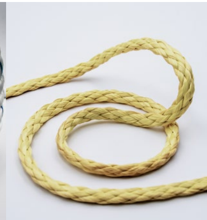
Aramid-Kunstfaser Aramid synthetic fiber