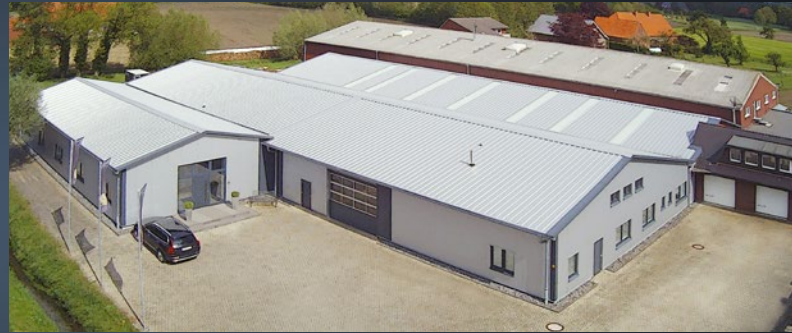
Standort | location Horstmar-Leer