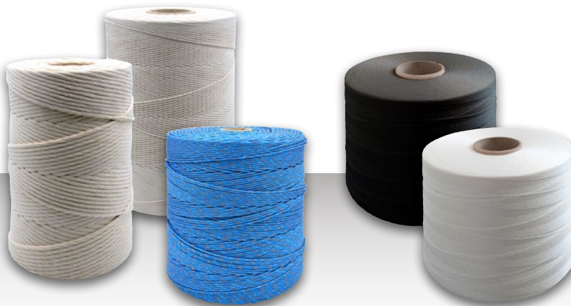
Kreuzspule XSP cross-wound spool xsp

Individuelle Logistiklösungen sowie geltende Normen- und Umweltaspekte werden berücksichtigt, um effiziente Handhabung, minimale Ausfallzeiten und höchste Sicherheit zu gewährleisten.