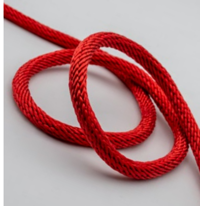
Polyamid-Kunstfaser Polyamid synthetic fiber

They are used as lashing and securing ropes, industrial ropes, high-performance ropes for heavy loads, and applications that require moisture or chemical resistance.