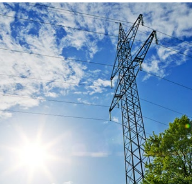
Hochleistungsseile High performance ropes

Hohe Qualität, präzise Verarbeitung und lange Lebensdauer zeichnen jedes Produkt von HÖLSCHER ROPES aus. Vertrauen Sie auf jahrzehntelange Erfahrung, Partnerschaft und nachhaltige Performance in jeder Anwendung.