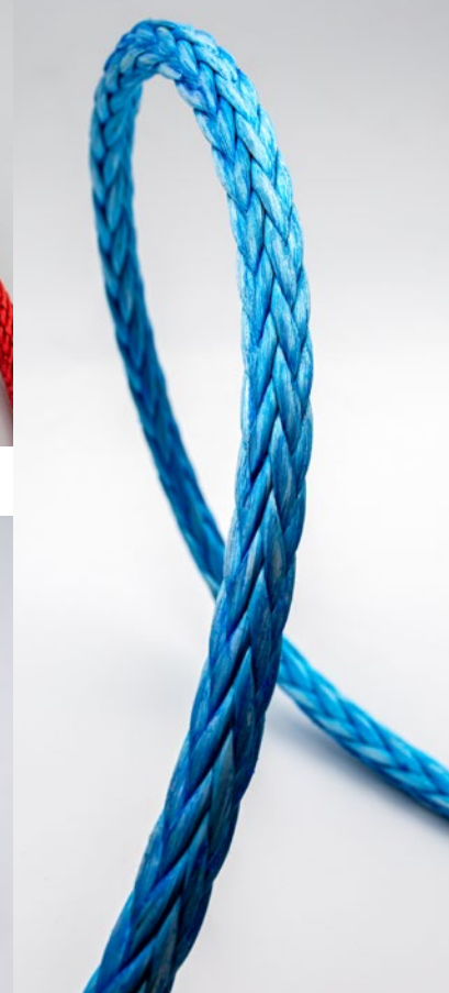
UHMWPE Polyethylen-Kunstfaser UHMWPE Polyethylen synthetic fiber