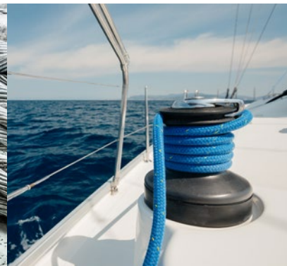
Zug- und Windenseile Pull and winch ropes