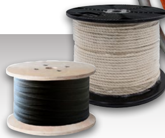
Scheibenspule - Holz- oder Kunststoff Disc coil - wood or plastic