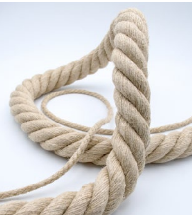
Hanf-Naturfaser Hemp natural fiber