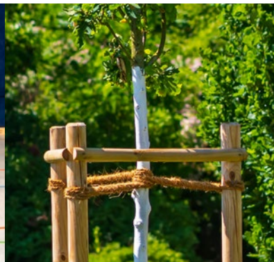
Forst- und Landwirtschaft Forestry and agriculture