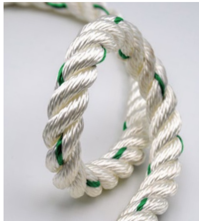
Polyester-Kunstfaser Polyester synthetic fiber