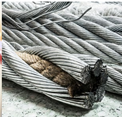
Drahtseileinlagen Wire rope inserts